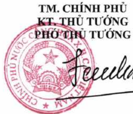
Lê Minh Khái